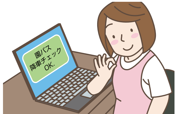
06 QRコード読み取り完了すると、責任者の管理画面には完了と表示され、チェック通知はストップします。