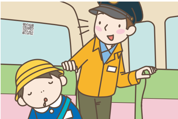
03 万が一、座席で眠っている園児がいても、置き去りを見逃しません！