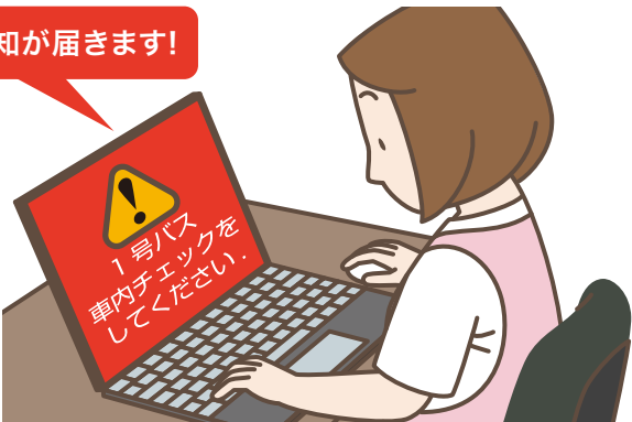
05 QRコード読み取りするまで園バスの責任者に通知やメール送信が何度もされます。