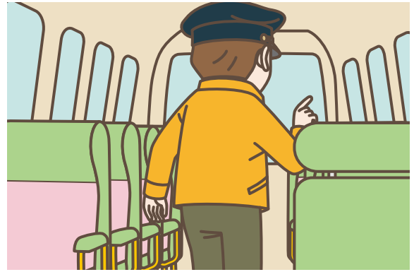
02 園児を降車させたあとは、後部座席に向かいながら座席をチェックします。