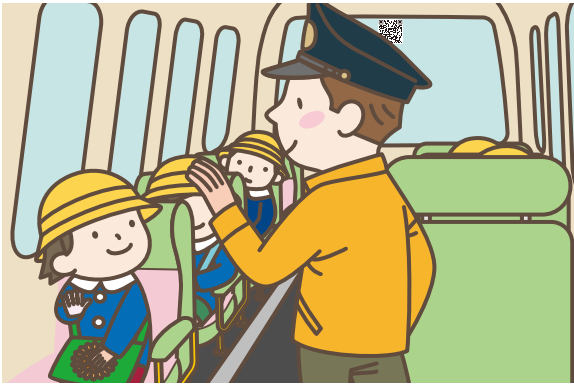
01 園に着いたら園児を降車させます。